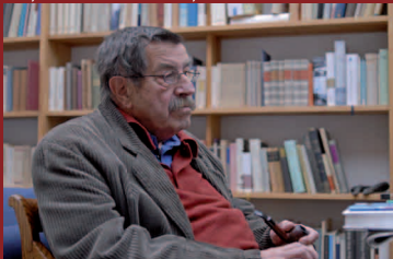
Der Schatten Günter Grass Mi, 17.2.2010 – Do, 18.3.2010