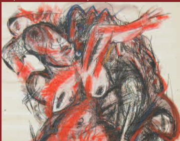
Die Unruhe oder der doppelte Boden Adolf Frohner Mi, 24.3.2010 – Do, 22.4.2010